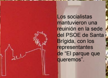
Los socialistas mantuvieron una reunión en la sede del PSOE de Santa Brígida, con los representantes de "El parque que queremos".