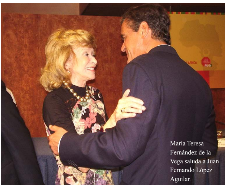
María Teresa Fernández de la Vega saluda a Juan Fernando López Aguilar.