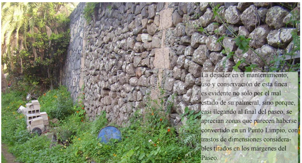
La dejadez en el mantenimiento, uso y conservación de esta finca es evidente no sólo por el mal estado de su palmeral, sino porque, casi llegando al final del paseo, se aprecian zonas que parecen haberse convertido en un Punto Limpio, con trastos de dimensiones considerables tirados en los márgenes del Paseo.