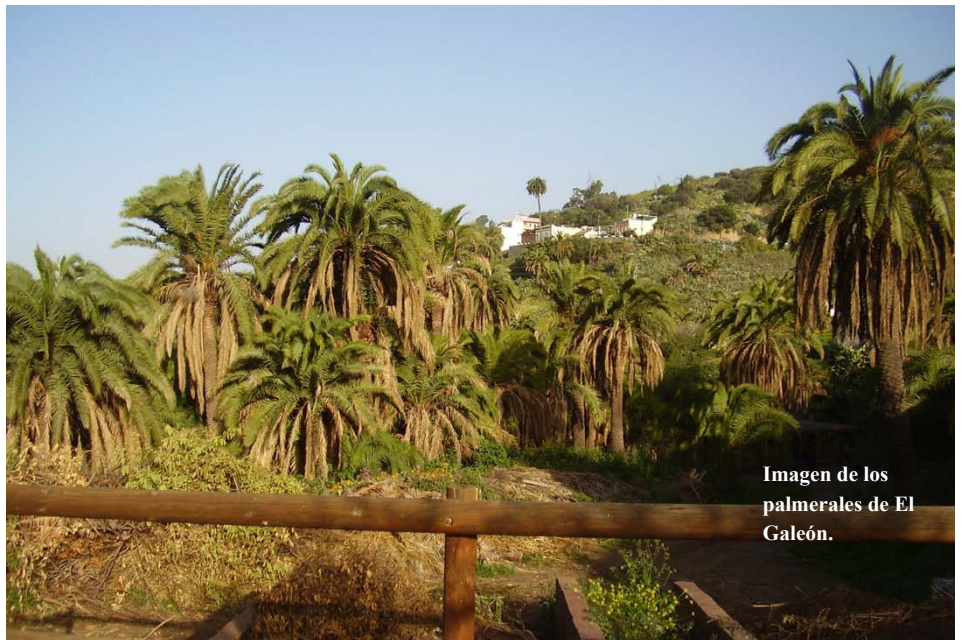
Imagen de los palmerales de El Galeón.

“Es importante que el emblema de nuestro municipio, la palmera, esté en buen estado”, aseveró Tejera.