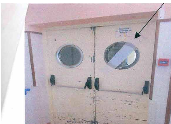
Puertas en mal estado, agarradas con gasas, en el Centro Socio-Sanitario El Sabinal.

Valora positivamente que el material y los recursos estén disponibles y con calidad "pero, ahondando más aun, el deterioro causado por el tiempo o el uso, tanto de herramientas y útiles, camas, mesas, camillas, persianas, como de cristales, puertas, etc. debe tener una revisión y mantenimiento continuos, así pues la reposición del material necesario es vital para un servicio de asistencia a lo/as usuario/as con la indispensable calidad".