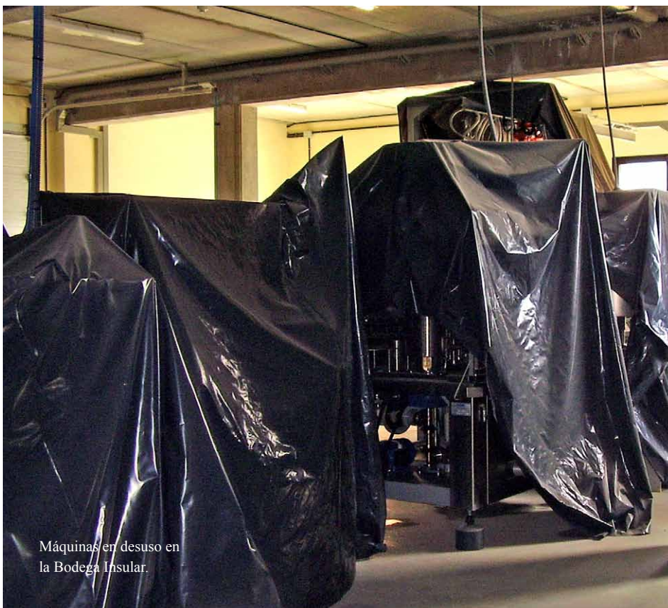
Máquinas en desuso en la Bodega Insular.