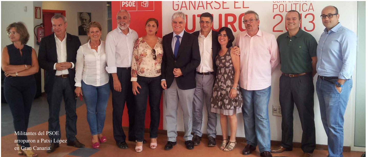
Militantes del PSOE arroparon a Patxi López en Gran Canaria.