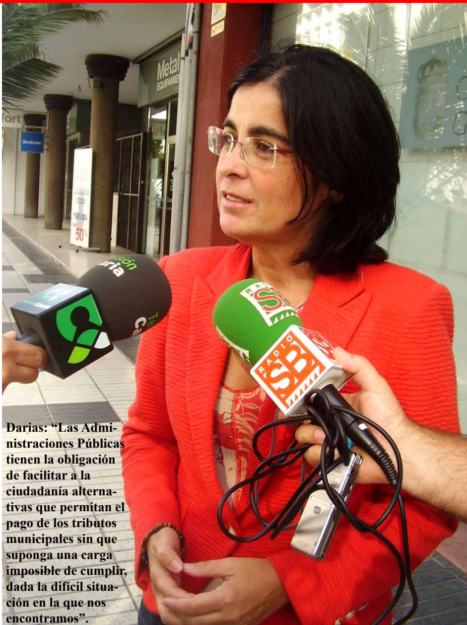
Darías: “Las Administraciones Públicas tienen la obligación de facilitar a la ciudadanía alternativas que permitan el pago de los tributos municipales sin que suponga una carga imposible de cumplir, dada la difícil situación en la que nos encontramos”.

Su función: el ejercicio de las facultades y funciones en materia