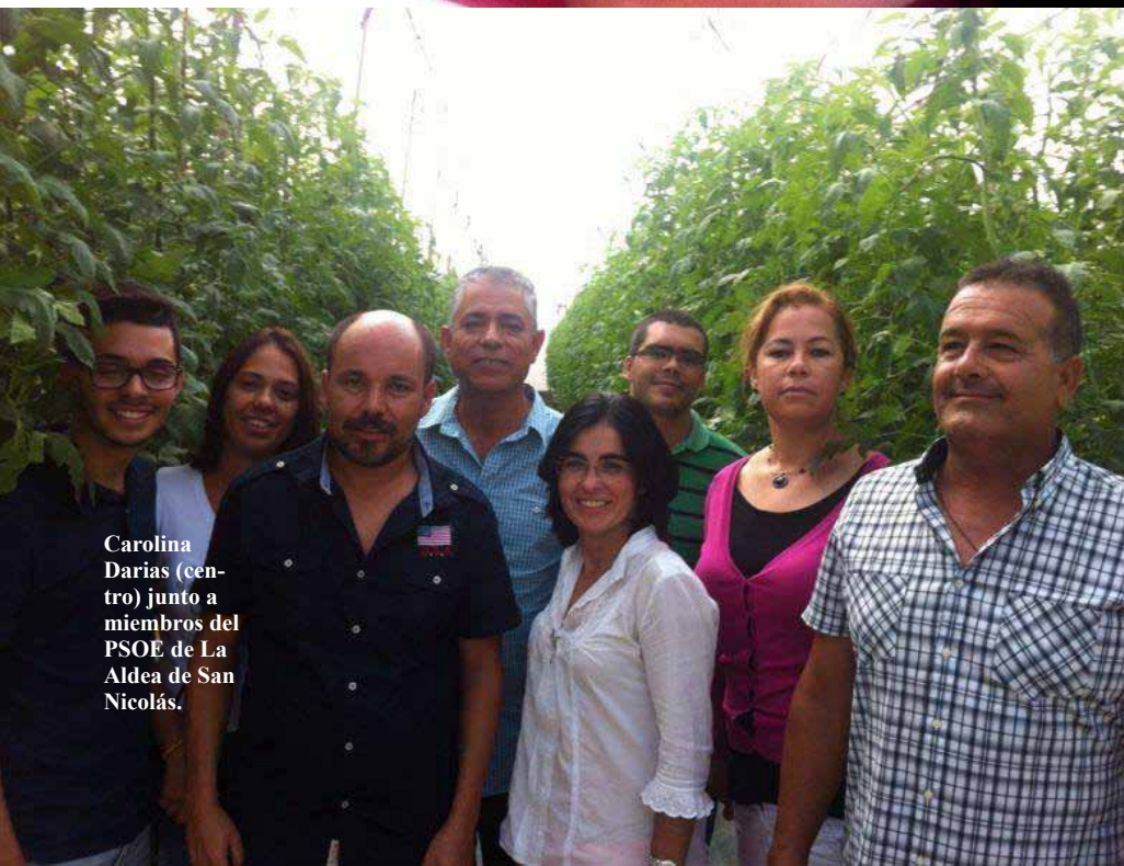
Carolina Darias (centro) junto a miembros del PSOE de La Aldea de San Nicolás.