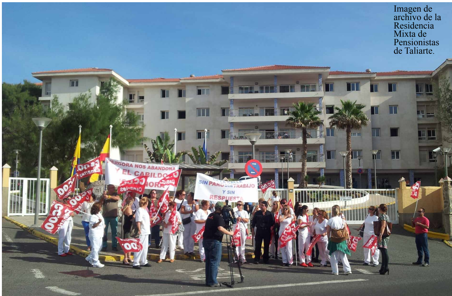
Imagen de archivo de la Residencia Mixta de Pensionistas de Taliarte.