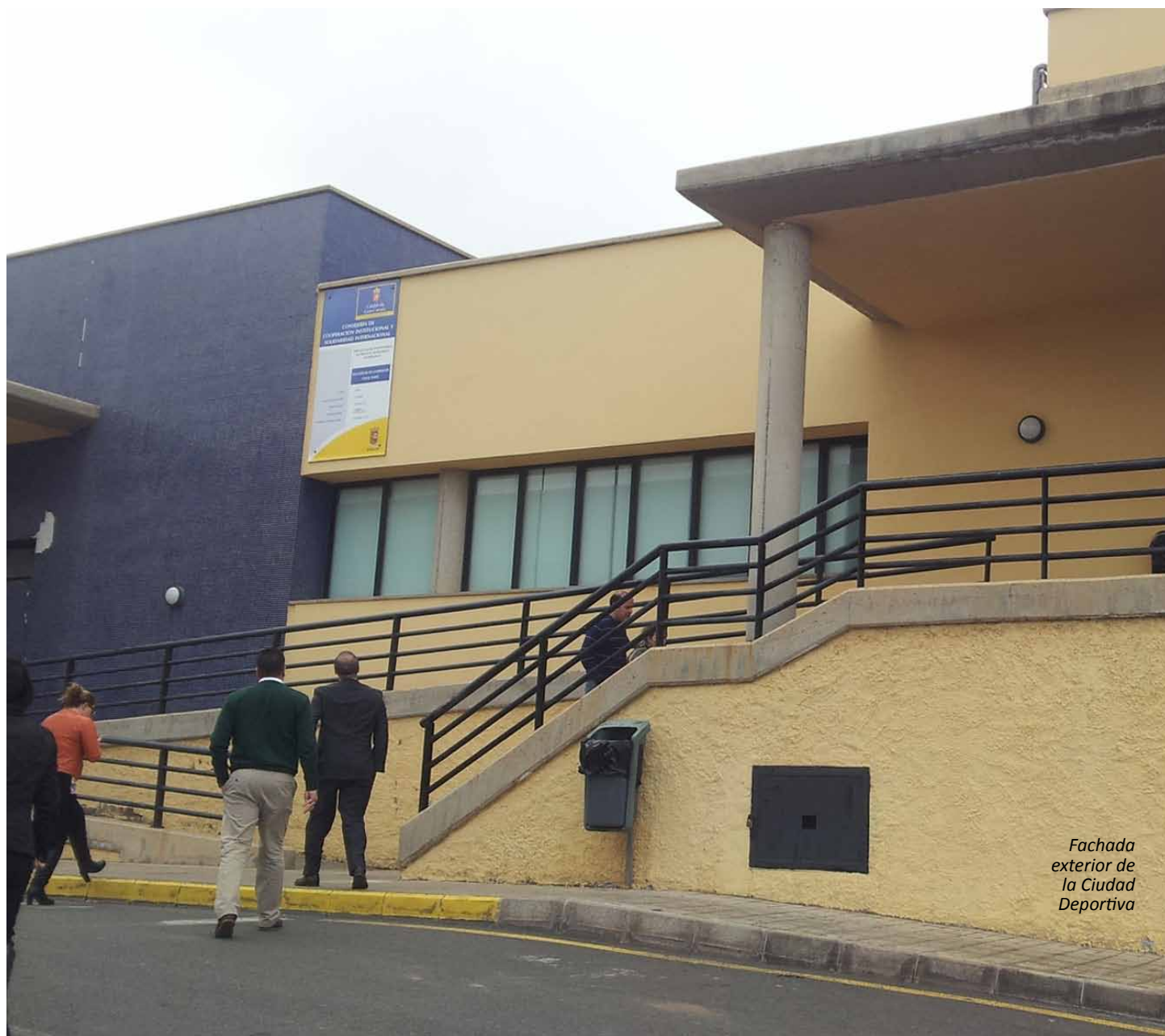
Fachada exterior de la Ciudad Deportiva

Además del gimnasio y la piscina municipales, cuenta con una serie de actividades deportivas al servicio de las personas que residen en este municipio, tales como Pádel, Tenis, un campo de fútbol siete, un campo de césped natural, un campo de césped artificial y triatlón.