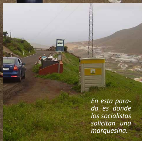
En esta parada es donde los socialistas solicitan una marquesina.

El barrio de Buena Vista, en Gáldar, tiene una población de 600 vecino/as, de lo/as cuales entre 16 y 24 de ello/as son alumno/as que cada día utilizan el transporte público para ir a los centros escolares.