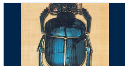
“El Escarabajo”

Hoy, que se conmemora el Día Internacional del Libro, traigo a mi memoria (“Oh Memoria, memoria”, como diría el poeta León Felipe”) un libro de esos que te marcan, que ya casi forman de lo que eres, y que ya jamás podrás olvidar.